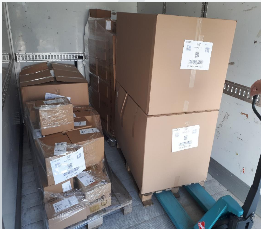
FOTO 6 – her vejer de mere end 11 kg, der var ingen tilladelse. Han fik en bøde men kom videre, fordi han åbnede og flyttede kasserne